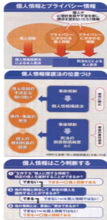
なお、個人情報保護法に関する詳細は下記資料をご参照下さい。 ・平成15年5月30日「個人情報の保護に関する法律」 ・国土交通省所管分野に係る個人情報保護に関するガイドライン

当社としては、今後個人データの入手、管理(開示、内容の訂正又は追加、消去など)に更なる注意を払い、社内規則を設け、徹底した管理を行っていかねばなりません。また、この場をお借りして、法律の施行に伴いオーナーの皆様のご理解とご協力をお願い申し上げます。