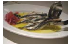
▲彦イワシと赤玉ねぎのマリネ