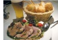
▲牛タンのサラダ仕立て