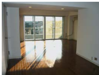
▲22帖のリビングには、明るい日差しが降りそそぎます。

所在/世田谷区成城1 間取/3LDK 専有面積/99.69㎡ 築年月/S43年2月 土地権利/所有権 所在階/1階 総戸数/31戸 管理形態/全部委託(日勤) 管理費/20,600円 修繕積立金/22,680円 現況/空室 引渡/相談 駐車場/権利有(月額2,800円)