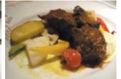
▲牛ほほ肉の赤ワイン煮込