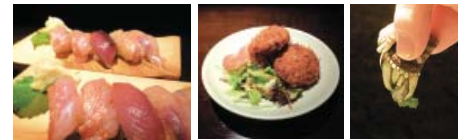
上段左から 島寿司、特製コロッケ、 亀の手(貝)。下段はおばんざい。

昔懐かしい昭和歌謡曲が流れ心休まる レトロな雰囲気、まるで島を訪れたような 気分になれる「ばんや しおさい」へ皆様も 足を運ばれては如何でしょうか。