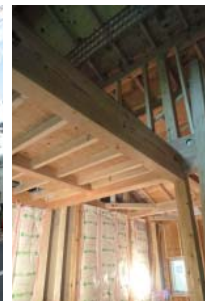
▲心安らく木造建築