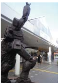
▲上井草駅とガンダム像