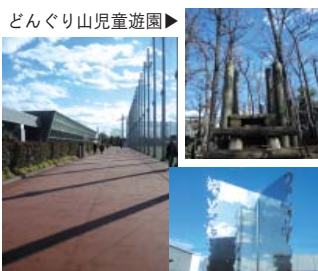
▲上井草スポーツセンター外観とオブジェ