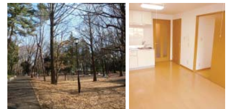
左上より時計回りに、近隣の公園、LDK、建物エントランス、明るい居室。